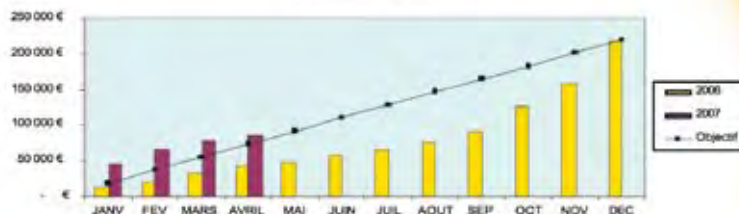
Courbe des dons

MERCI à tous ceux qui soutiennent le ministère de la Ligue ! Votre soutien nous permet de continuer les activités de camps et le travail d'évangélisation.