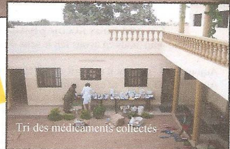
Tri des médicaments collectés