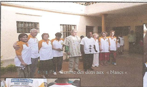
Remise des dons aux « blancs »