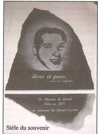
Stèle du souvenir

En marche depuis Aout 2007 et quelques mois de rodage ... avec 60 enfants et autant d'adultes et officiels , la grande fête du centre et son inauguration pouvait avoir lieu... La joie des enfants comme cadeaux